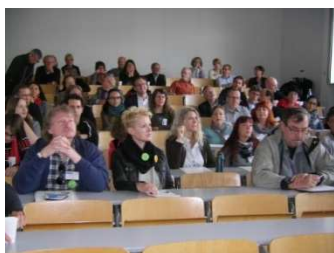
Workshop C: Reform der Sozialen Dienste und Ländervergleich